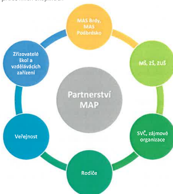
Obrázek 2 Organizace partnerství v pracovních skupinách

Schváleno Řídícím výborem MAP III ORP Příbram dne 18.5.2022.