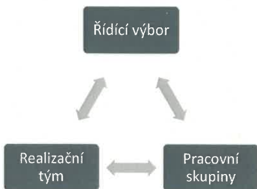
Obrázek 1 Organizační struktura MAP IV ORP Příbram

Podle aktuální potřeby je komunikace mezi členy RT MAP a PS zajištěna prostřednictvím telefonů, e-mailů, sdíleného disku, společné uzavřené skupiny na sociální síti apod. Možnosti jednání lze uspořádat formou prezenční, online i hybridní. Rozhodování na úrovni RT MAP a dalších složek projektu MAP lze formou prezenční i elektronicky, tedy formou per rollam.