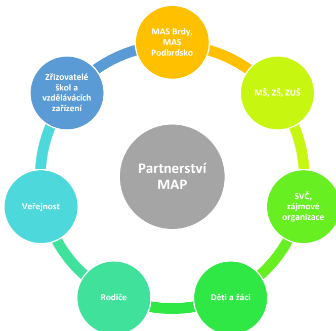
Obrázek 2 Organizace partnerství v pracovních skupinách

V průběhu realizace projektu může docházet na základě průběžného vyhodnocování řízení projektu k dílčím aktualizacím organizační struktury.